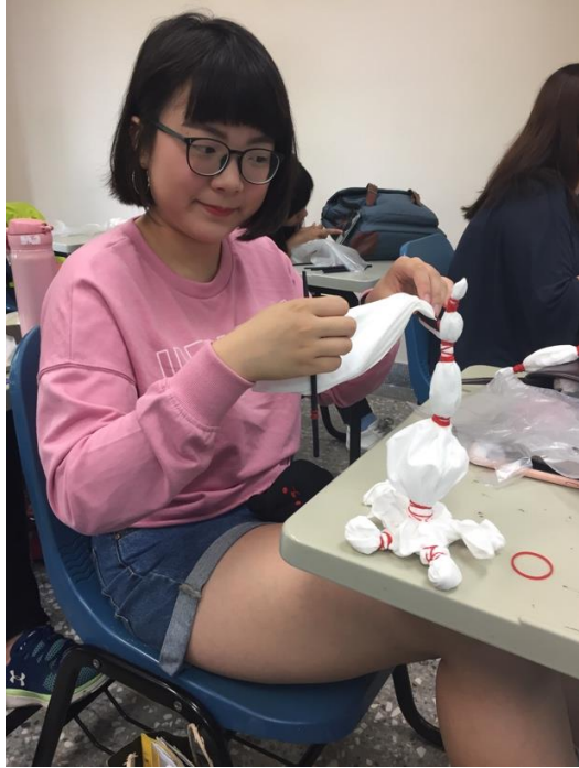
我可愛的朋友與我的宇宙發射器。