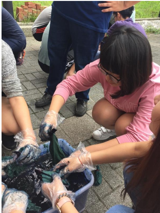
朋友與藍染劑。有點不好聞，像水溝味。