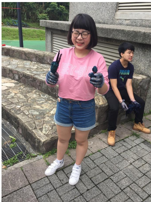
朋友與氧化完的布料。