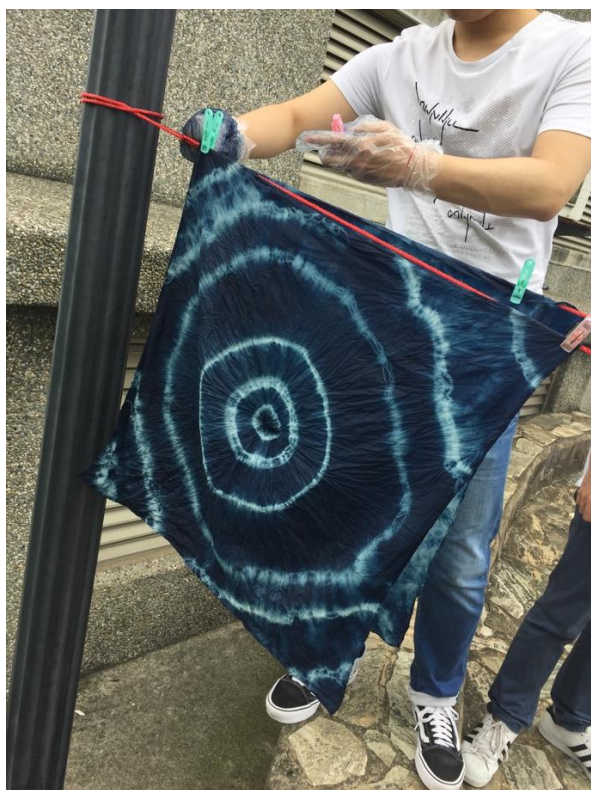
我的宇宙發射器晾乾中，好期待乾掉後的成果！