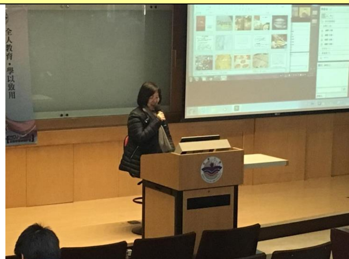
圖 2：歡迎並介紹業師