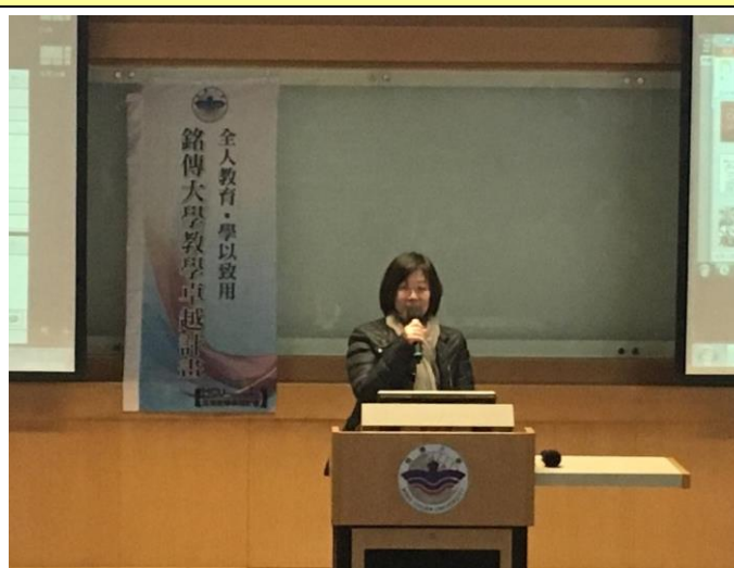
圖 1：歡迎並介紹業師