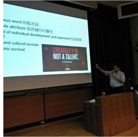
圖 2 : (說明)