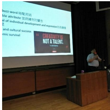
圖 3 : (說明)