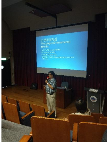
圖 1 : (說明)