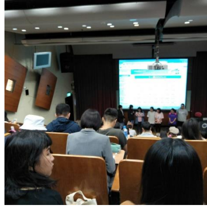
圖 4 : (說明)