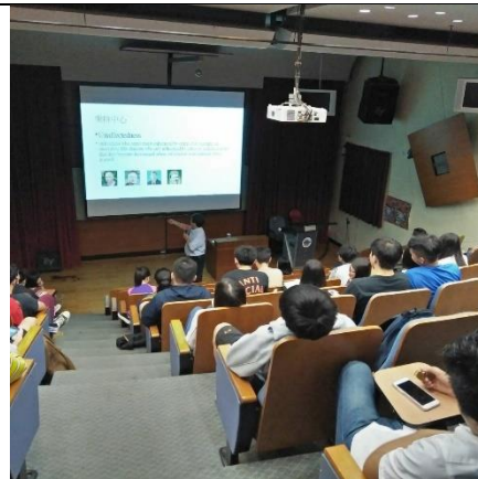
圖 6 : (說明)