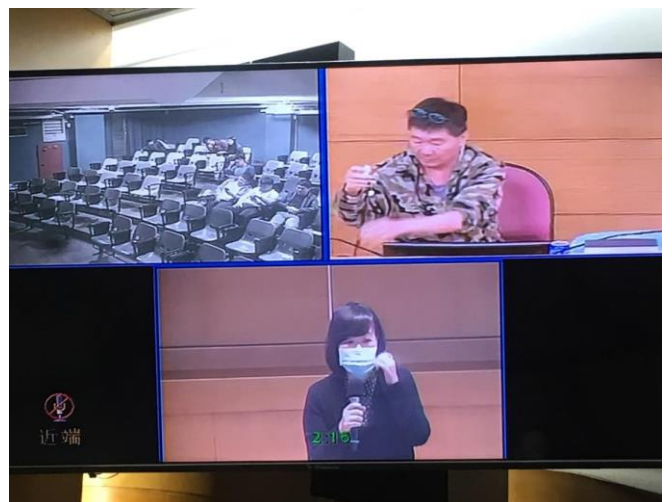
圖 6：業師 Q&A