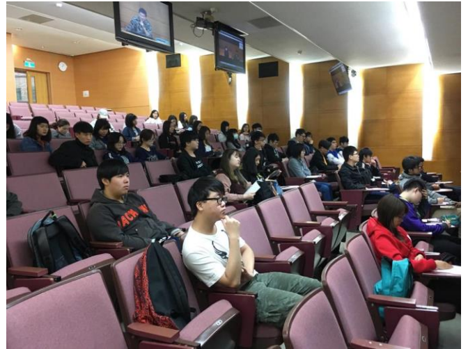
圖 2：歡迎並介紹業師