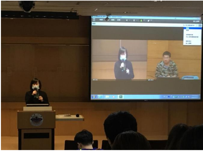
圖 1：歡迎並介紹業師