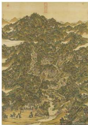
清姚文瀚·袁峽合筆盤山圖 軸 440x315