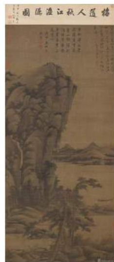
元吳鎮 秋江漁隱圖 89.1x88.5