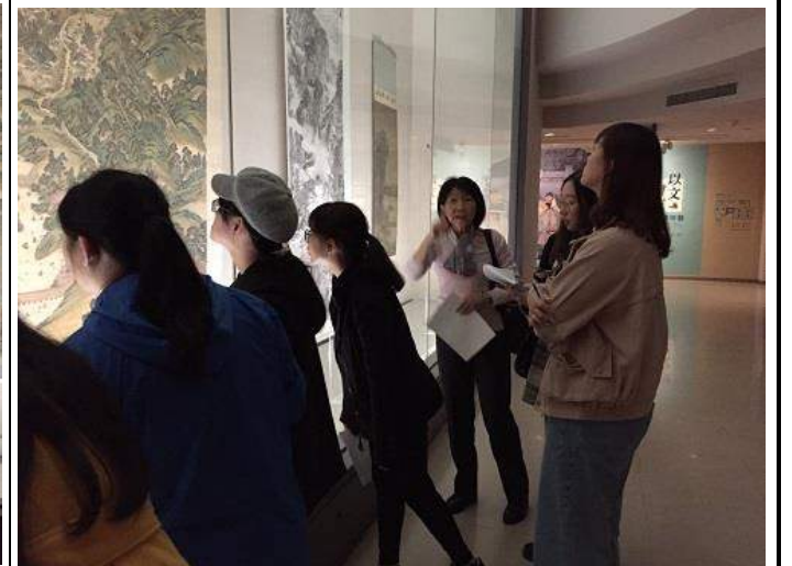
圖 4：同學欣賞巨幅繪畫