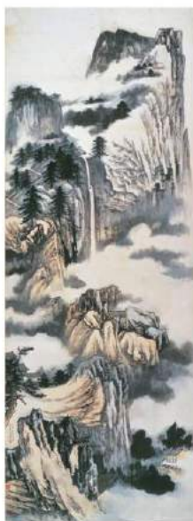
民國張大千 華岳高秋 軸 361x133.6