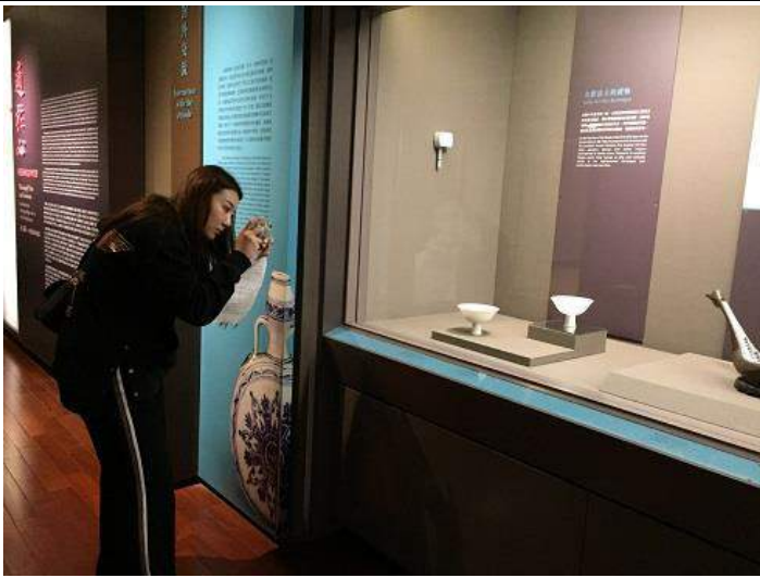
圖 9：學欣賞明代甜白瓷器