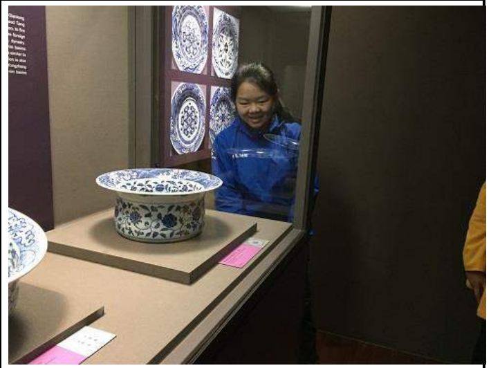
圖 10：同學欣賞明代青花瓷