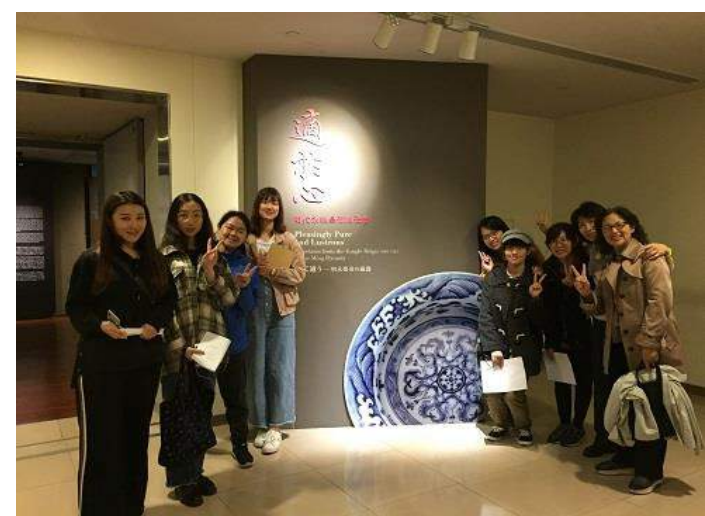
圖 5：參觀「適於心」明代瓷器展