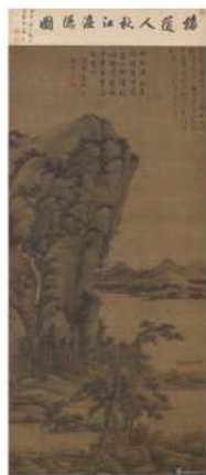
元吳鎮 秋江漁隱圖 89.1x88.5