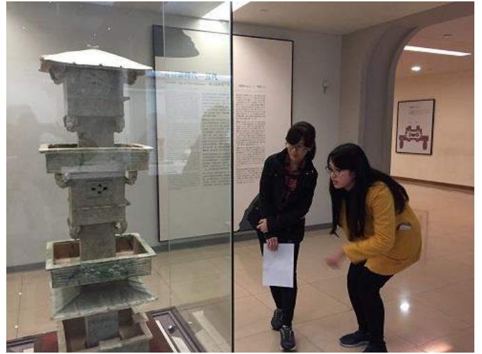
圖 7：同學欣賞漢代綠釉樓閣