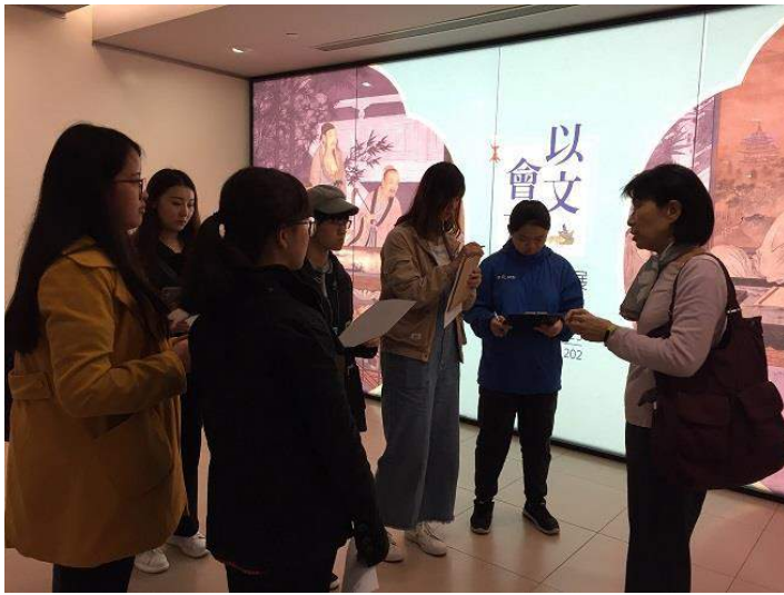
圖 1：參觀「以文會友」展