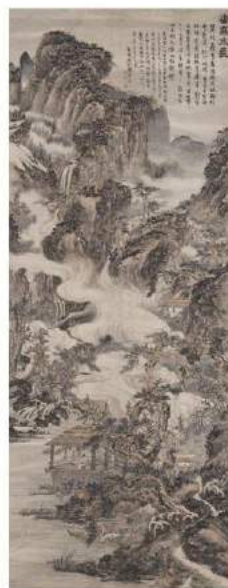
清覺殘 山高水長圖 軸 332.1x127