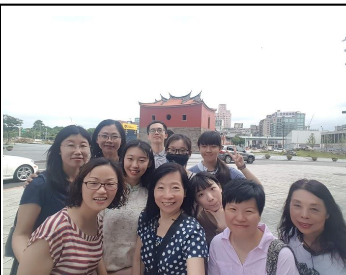
圖 6：全體上課師生合影