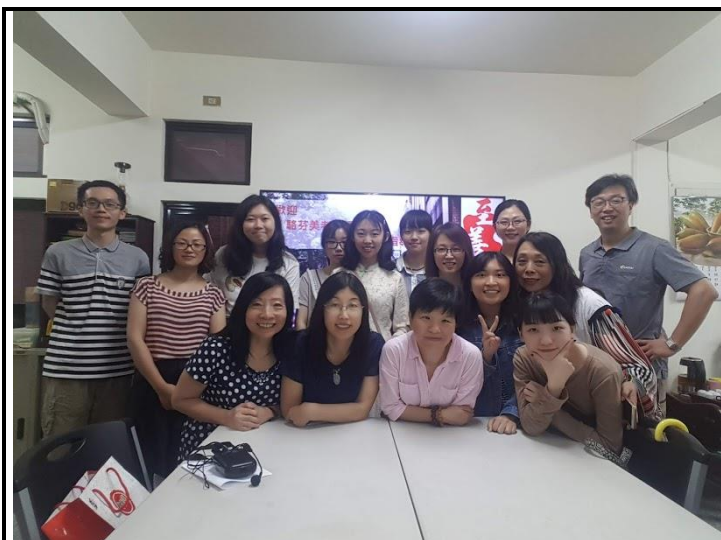
圖 5：全體上課師生合影