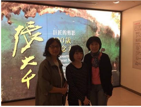
圖 1：故宮博物院張大千 120 歲紀念展