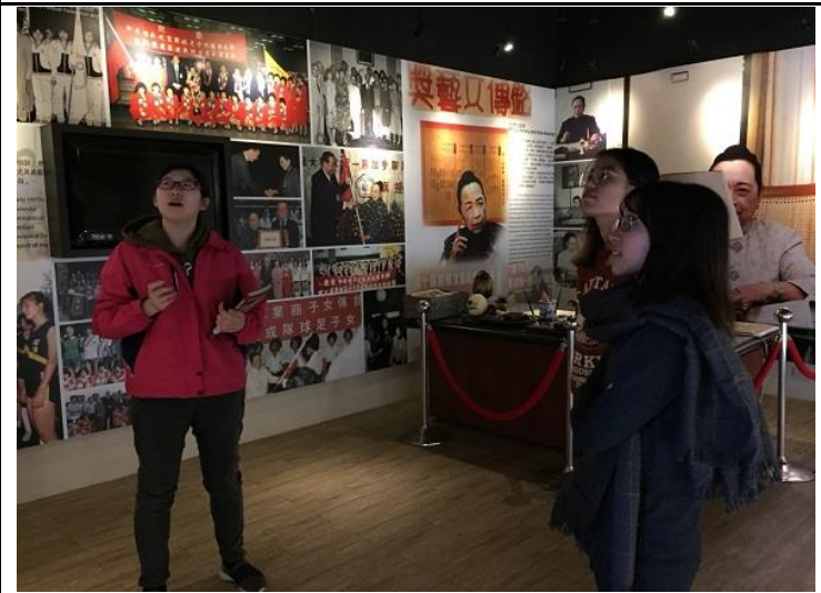
圖 6：修課同學在創辦人紀念館進行導覽實做