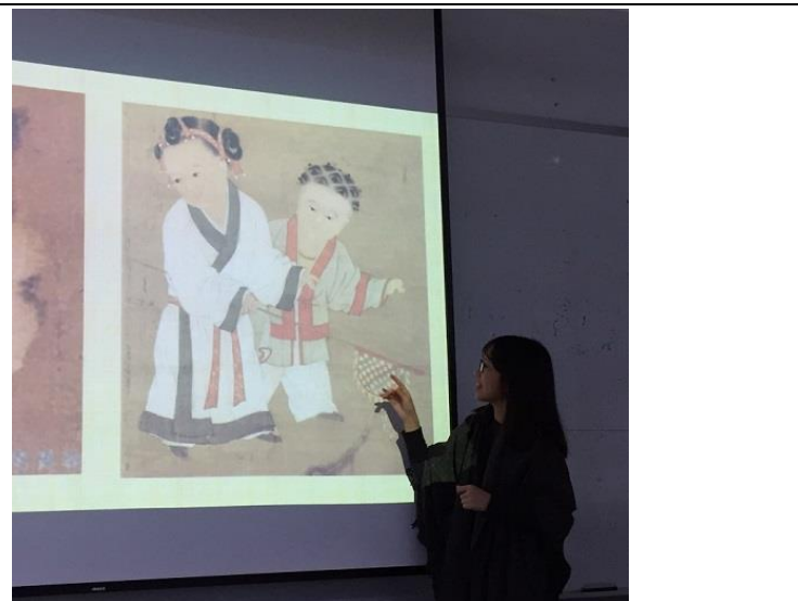
圖 12：修課同學進行故宮導覽口頭報告