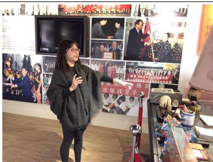
圖 10：修課同學在創辦人紀念館進行導覽實做