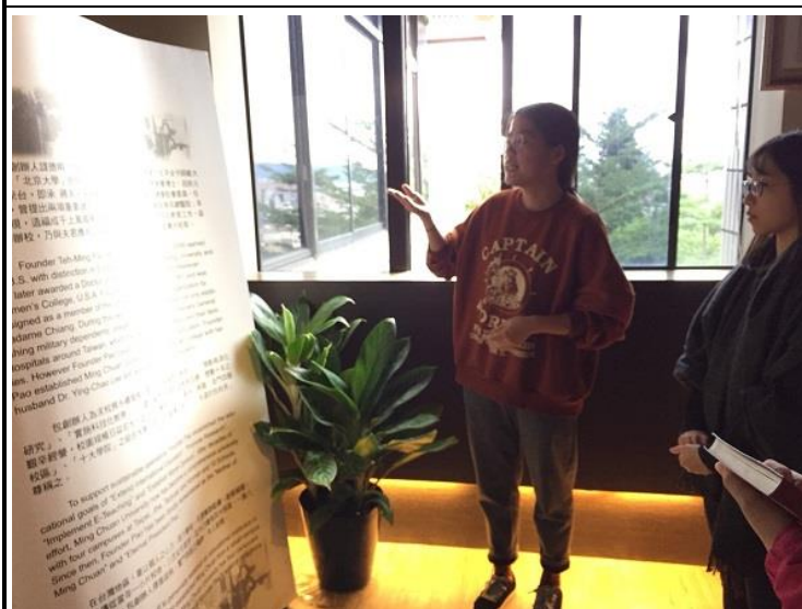
圖 9：修課同學在創辦人紀念館進行導覽實做