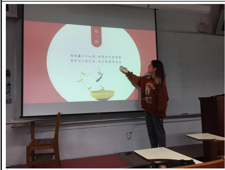
圖 11：修課同學進行故宮導覽口頭報告