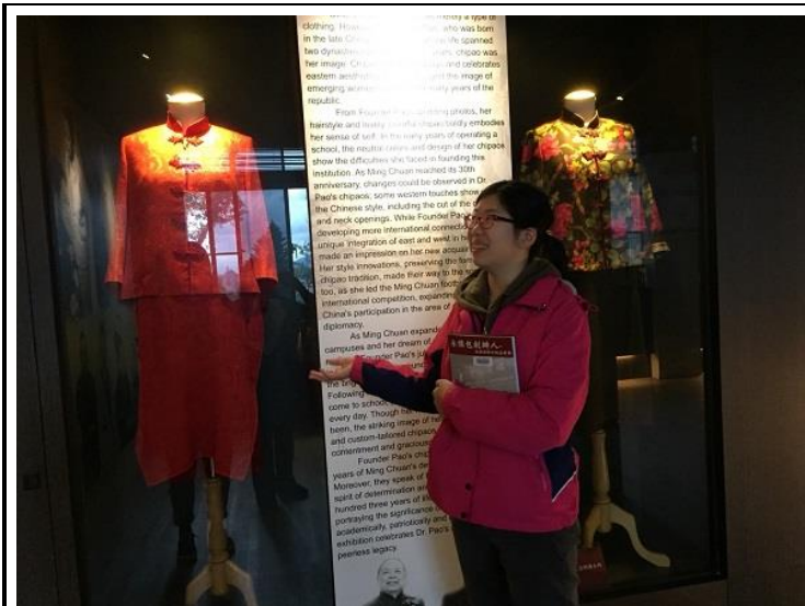
圖 7：修課同學在創辦人紀念館進行導覽實做