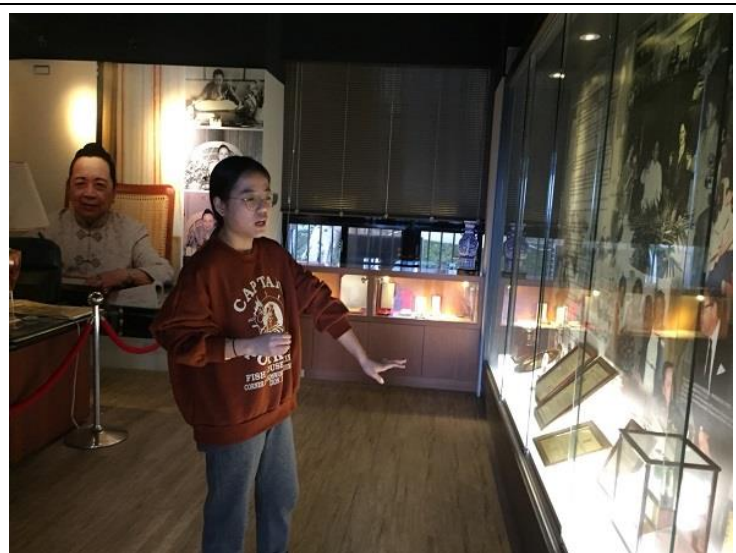
圖 8：修課同學在創辦人紀念館進行導覽實做