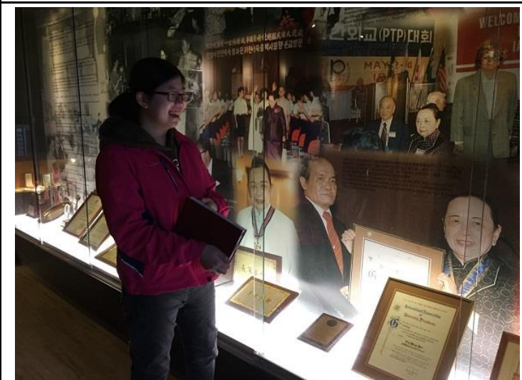
圖 5：修課同學在創辦人紀念館進行導覽實做