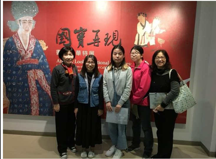
圖 1：故宮博物院導覽全體合影