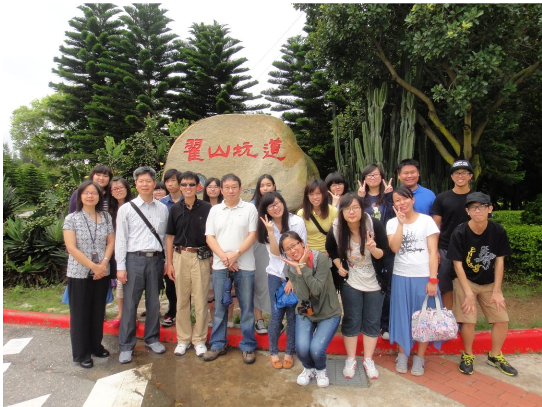
6月25日銘傳大學師生參觀金門翟山坑道