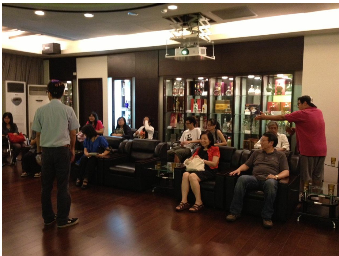
6月26日銘傳大學師生參訪金酒公司，進行產業文化座談。