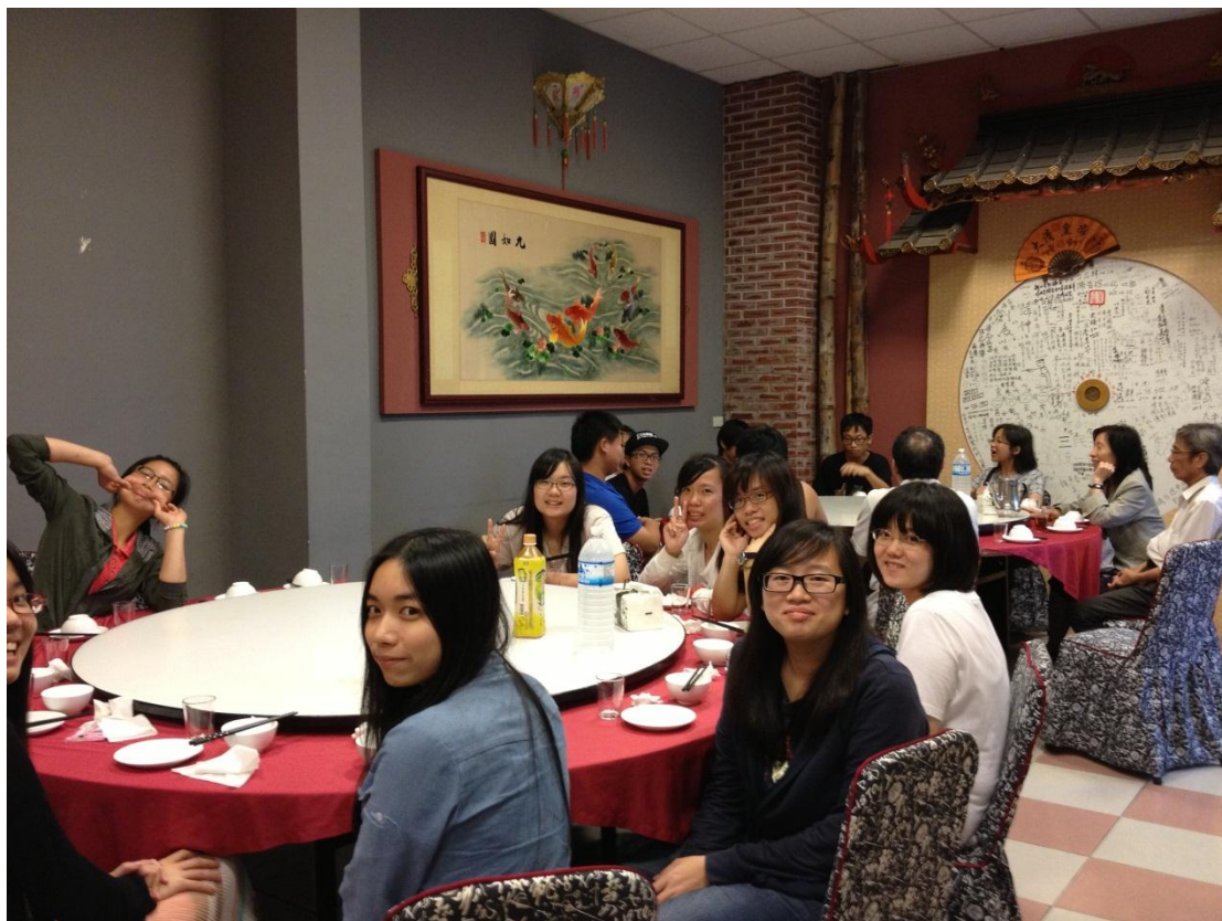
6月25日銘傳大學師生於金寧洪師父餐廳用餐