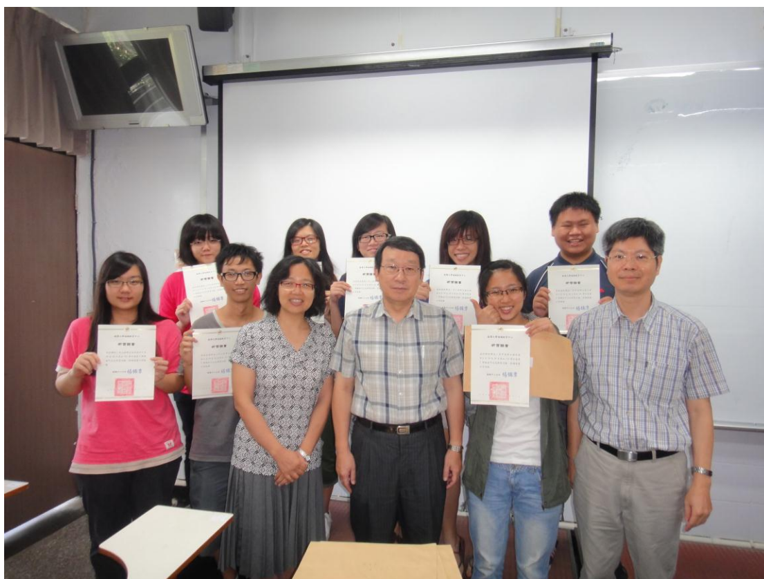
7月3日舉行移地教學成果發表會並頒發研習證書