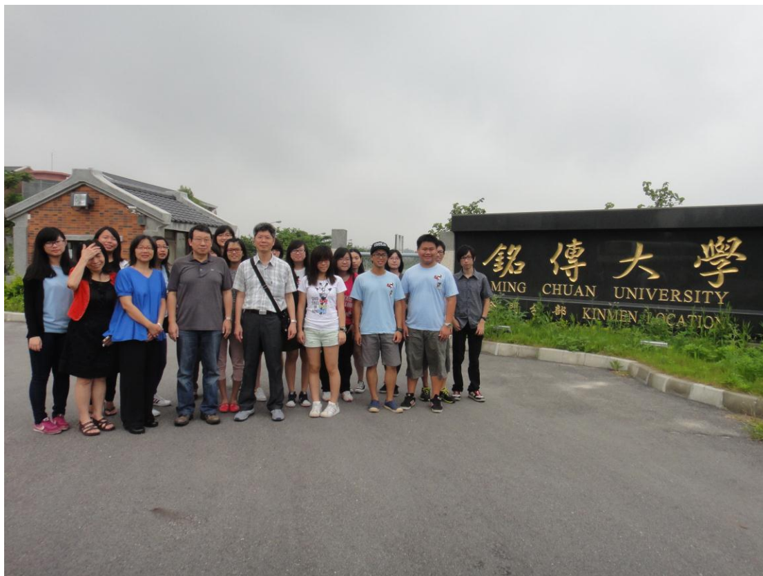
6月26日參與移地教學師生於金門分部校門前合影